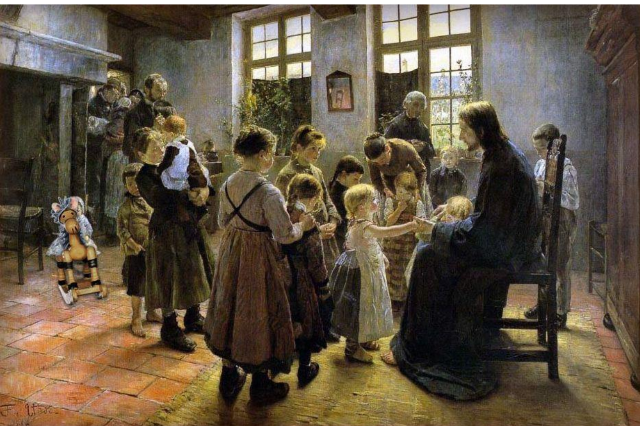
Fritz von Uhde, Gesù e i bambini.