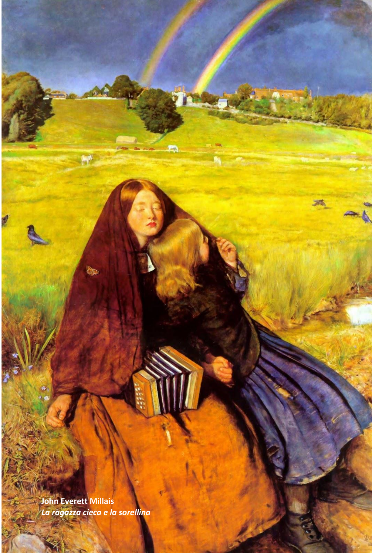
John Everett Millais La ragazza cieca e la sorellina