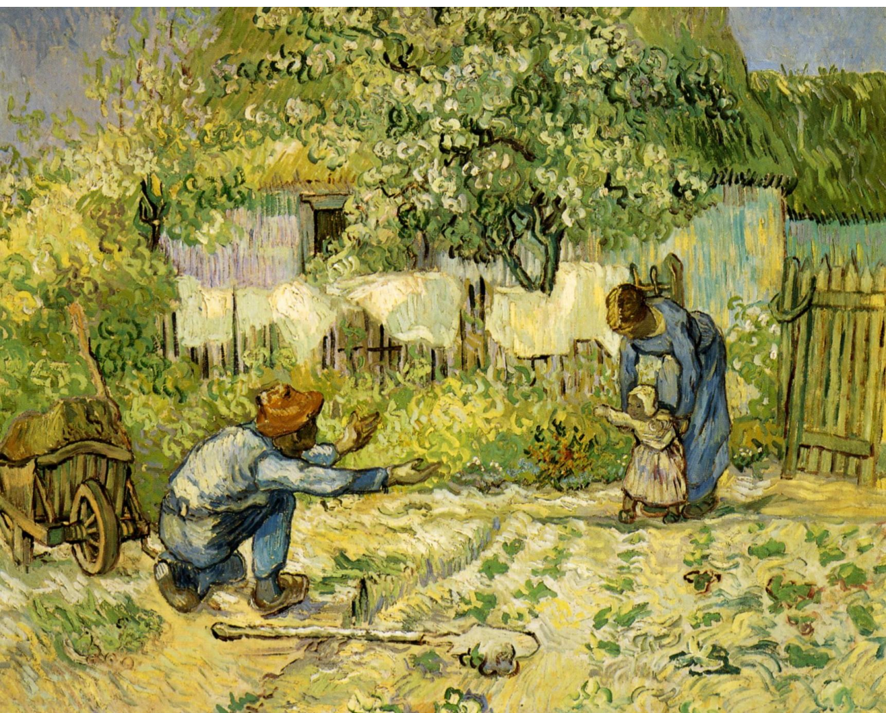
Vincent van Gogh Primi passi