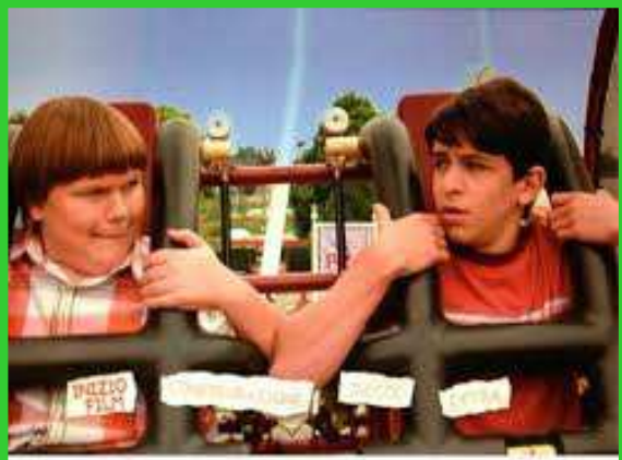
Il menu del disco Blu-ray è occupato interamente da un elaborato loop che alterna dei disegni animati a sequenze tratte dal film